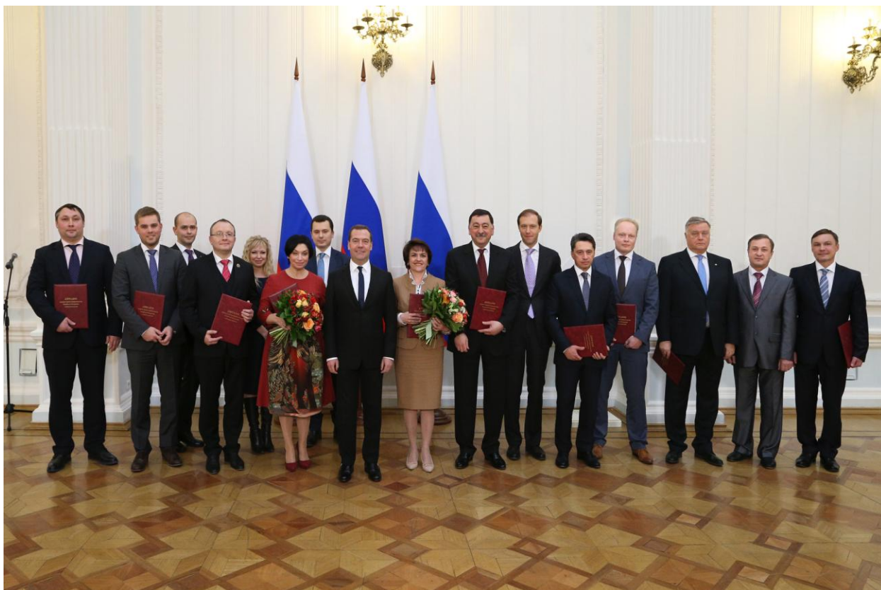
Церемония награждения лауреатов премии Правительства Российской Федерации в области качества 2014 года. (29 января 2015 г., Дом приемов Правительства Российской Федерации)

5.5. Организации-лауреаты используют эмблему премии в рекламных целях с указанием года(ов) присуждения премии и названия организации и должны соблюдать требования п. 1.1 настоящего Руководства.